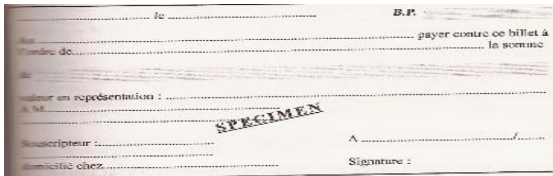
Schéma : émission d'un billet à ordre